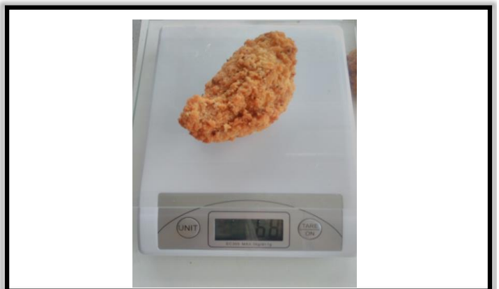
PESO 40-90 gr.