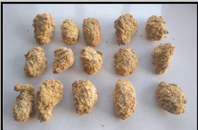
ASPECTO GENERAL DEL PRODUCTO