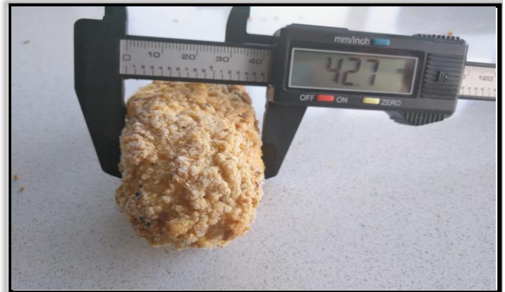
MED ANCHO: Medidas aproximadas