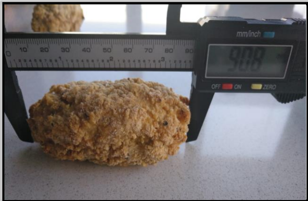
MED. LARGO: Medidas aproximadas